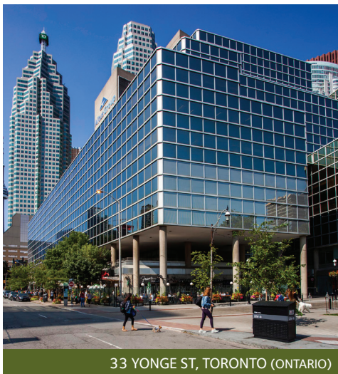
33 YONGE ST, TORONTO (ONTARIO)