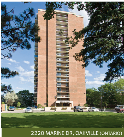
2220 MARINE DR, OAKVILLE (ONTARIO)