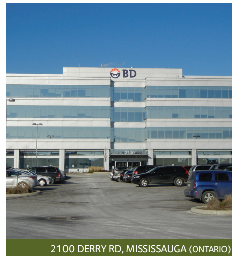
2100 DERRY RD, MISSISSAUGA (ONTARIO)

Grâce à un élément du rendement, la plus-value en capital, le Fonds immobilier de la Great-West a affiché son plus haut rendement trimestriel depuis 2013, soit un pourcentage brut de 2,2 %, portant ainsi le rendement annuel total à 3,4 %. Voici un résumé des faits saillants du deuxième trimestre :