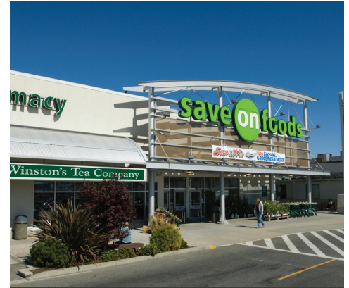
Country Club Centre, Nanaimo (C.B.)

Durant trois trimestres de 2019, le Fonds immobilier de la Canada Life a rapporté aux investisseurs un rendement total brut de 6,4 % ainsi qu'un résultat de 8 % sur une période mobile de 12 mois. Les rendements depuis le début de l'année provenaient à parts égales des revenus et du capital, à cause du taux d'inoccupation limité du portefeuille, de la hausse des loyers et d'un climat d'investissement sain. Le rendement s'est accru durant chaque trimestre toute l'année, le troisième ayant produit 230 points de base supplémentaires. Son activité a été marquée par l'achèvement de plusieurs mandats de financement, dont voici les détails :