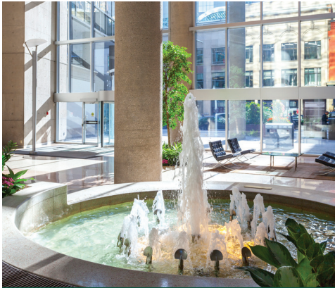
33 Yonge St, Toronto (Ontario)