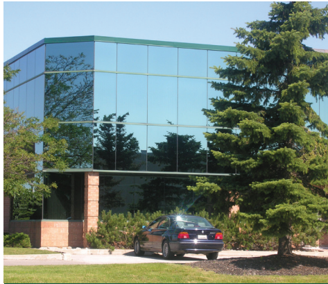
Superior Business Park, Mississauga (Ontario)