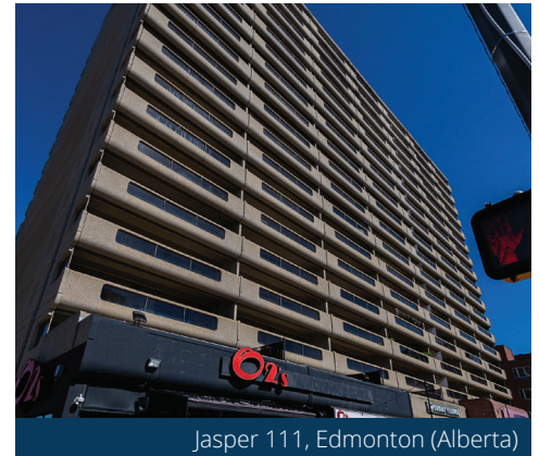
Jasper 111, Edmonton (Alberta)

Le Fonds immobilier de la Great West a clôturé la décennie en récompensant les investisseurs par son plus haut rendement annuel depuis 2013. Le quatrième trimestre a constitué la meilleure période de cette année, avec 270 points de pourcentage, contribuant au total de 9,1 % sur douze mois. Le rendement global a été calculé selon un équilibre entre les revenus et le capital, à mesure que les éléments fondamentaux du portefeuille se renforçaient dans tous les secteurs.