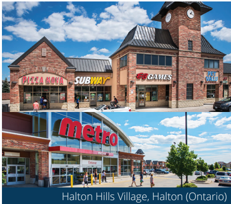
Halton Hills Village, Halton (Ontario)