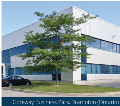
Goreway Business Park, Brampton (Ontario)