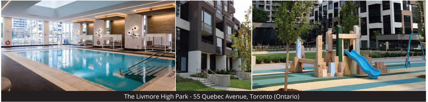
The Livmore High Park - 55 Quebec Avenue, Toronto (Ontario)

Le Fonds immobilier de la London Life a présenté un rendement brut total de 2,6 % pour le troisième trimestre, surtout à cause de la stabilité de l'élément revenu à 1,0 %. Malgré les difficultés actuelles attribuables à la pandémie mondiale, les revenus ont été stimulés par des niveaux élevés d'occupation et de perception. Les niveaux accrus de placement et de location à bail ont contribué à améliorer, au cours du trimestre, la visibilité des paramètres d'évaluation, permettant aux évaluateurs de lever les conditions visant la catégorie d'actifs des immeubles multifamiliaux et certains immeubles industriels. À la fin du trimestre, la plupart des évaluations immobilières restent conditionnelles, de sorte que la suspension temporaire du Fonds demeure en vigueur.