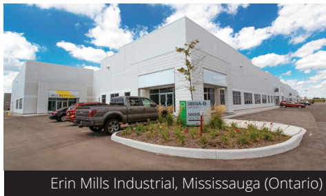
Erin Mills Industrial, Mississauga (Ontario)