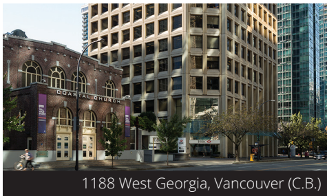
1188 West Georgja, Vancouver (C.B.)