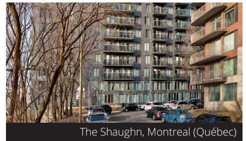
The Shaughn, Montreal (Québec)