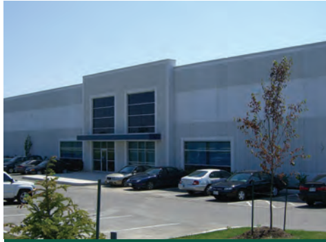
8400 Lawson, Milton (Ontario)