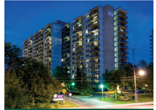
The Riversides, Ottawa (Ontario)

Le Fonds immobilier de Canada-Vie a clôturé l'année en soulignant l'importance de la diversification du portefeuille et d'une stratégie défensive de placement de titres. Au milieu d'une pandémie mondiale, il a fait preuve de résilience dans le rendement des revenus et produit des recettes en capital stables au niveau des propriétés, suscitant un solide rendement relatif. Il a annoncé le retour de la confiance envers l'évaluation tôt en janvier 2021 à mesure que les niveaux de placement et de location à bail amélioraient la visibilité des marchés, fournissant les données nécessaires pour documenter et soutenir les évaluations immobilières. Il s'agit d'une première étape critique dans son retour aux opérations courantes. Le 11 janvier 2021, les contributions et virements au Fonds ont repris.