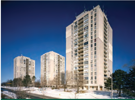
Bayview Village Apts, Toronto (Ontario)